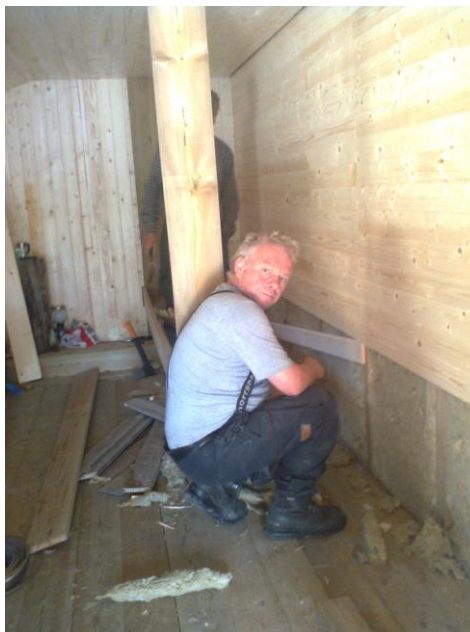
Isolering av oppsynsrom i nauset Fremre Vulutjønn.

Fjellopsynet informerte 63 personer i felt. I tillegg ble mange informert gjennom e-post, telefon/sikringsradio og på hjemmesiden til Fjellstyret. Oppsynet har kontrollert jakt og fiskekort, båndtvangsbestemmelser, motorferdsel samt oppsyn i forbindelse med verneforskriftene for Rondane nasjonalpark.