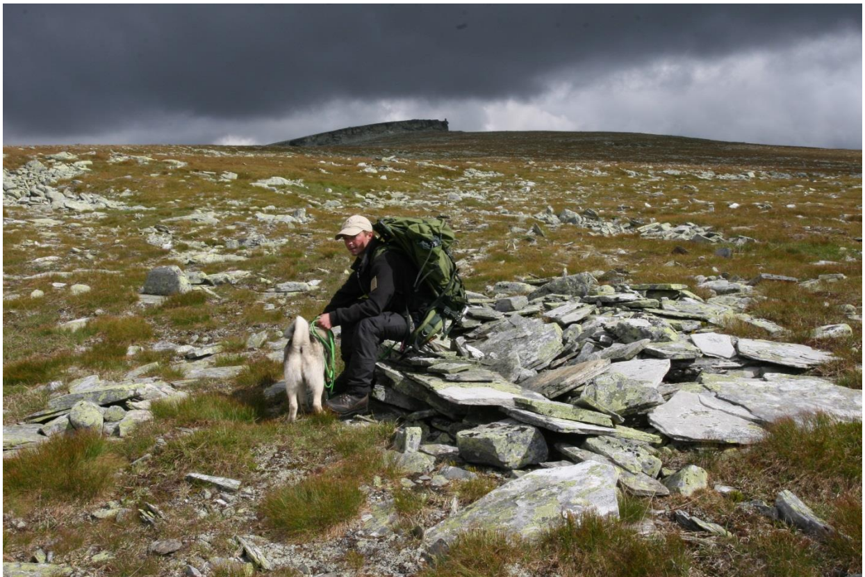
Massefangstanlegg på Bløyvangen.

Vulufjell statsallmenning, Sel og Nordre Kolloen statsallmenninger, Frylia, Gråhøa, Østkjølen og Mathisen Atna as(vassbulia).