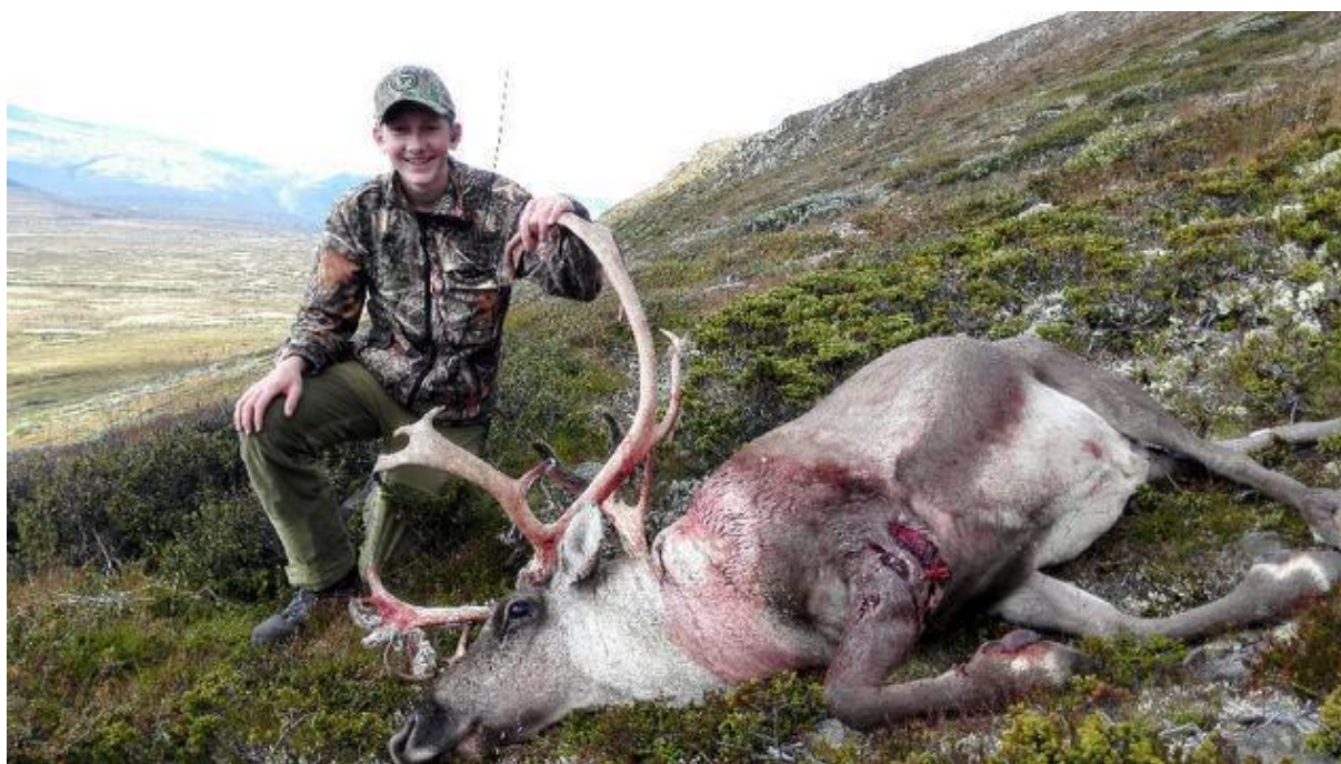
Lykkelig førstegangsjeger