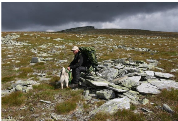
Massefangstanlegg på Bløyvangen

Jaktopplegg med forbud mot bruk av sikringsradio/jaktradio under jakt, og at simle og kalvekortene blir tildelt samlet, fører til rolige reinsflokker og fin jakt.